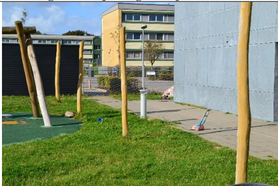
Redskab: Stolper til læsejl Årgang: Producent: Er redskabet mærket: Nej Er der registreret fejl/mangler: Nej