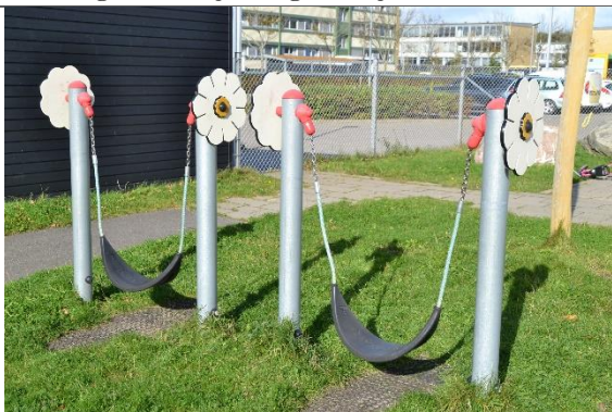
Redskab: Mavegynger Årgang: 2017 Producent: Kompan Er redskabet mærket: Ja Er der registreret fejl/mangler: Nej