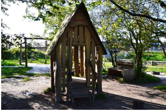
Redskab: Legehus Årgang: 2017 Producent: Kompan Er redskabet mærket: Ja Er der registreret fejl/mangler: Ja