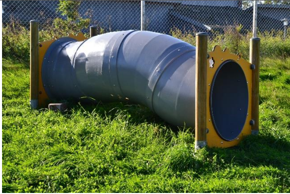
Redskab: Tunnel Årgang: 2017 Producent: Kompan Er redskabet mærket: Ja Er der registreret fejl/mangler: Nej