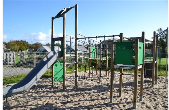
Redskab: Klatrestativ med rutsjebane Årgang: 2017 Producent: Kompan Er redskabet mærket: Ja Er der registreret fejl/mangler: Nej