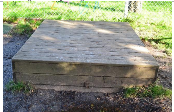
Redskab: Scene Årgang: Producent: Er redskabet mærket: Nej Er der registreret fejl/mangler: Nej