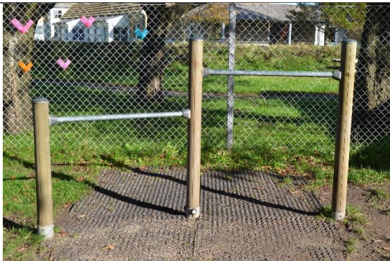
Redskab: Kolbøttestænger Årgang: 2017 Producent: Kompan Er redskabet mærket: Ja Er der registreret fejl/mangler: Ja