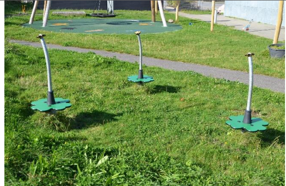
Redskab: Spica Årgang: 2017 Producent: Kompan Er redskabet mærket: Ja Er der registreret fejl/mangler: Ja