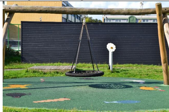
Redskab: Fugleredegynge Årgang: 2017 Producent: Norleg Er redskabet mærket: Ja Er der registreret fejl/mangler: Nej