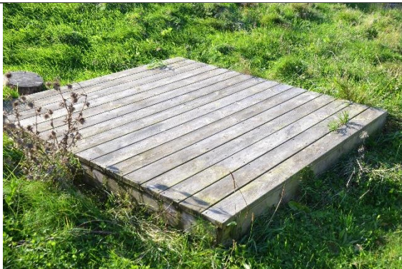
Redskab: Scene Årgang: Producent: Er redskabet mærket: Nej Er der registreret fejl/mangler: Nej