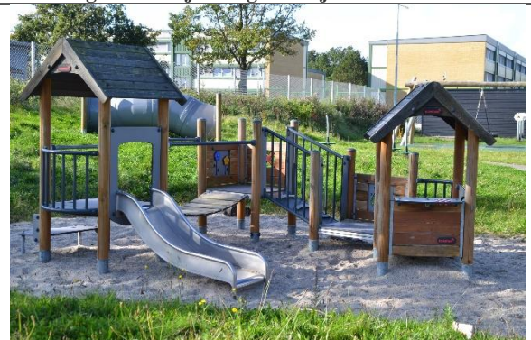
Redskab: Klatrestativ Årgang: 2017 Producent: Kompan Er redskabet mærket: Ja Er der registreret fejl/mangler: Nej