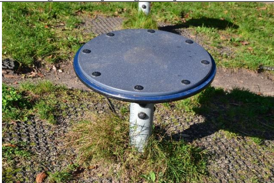
Redskab: Wacky Spinner Årgang: 2017 Producent: Kompan Er redskabet mærket: Ja Er der registreret fejl/mangler: Nej