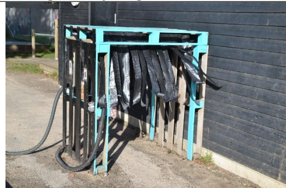
Redskab: Vaskehal Årgang: Producent: Egen produktion Er redskabet mærket: Nej Er der registreret fejl/mangler: Nej