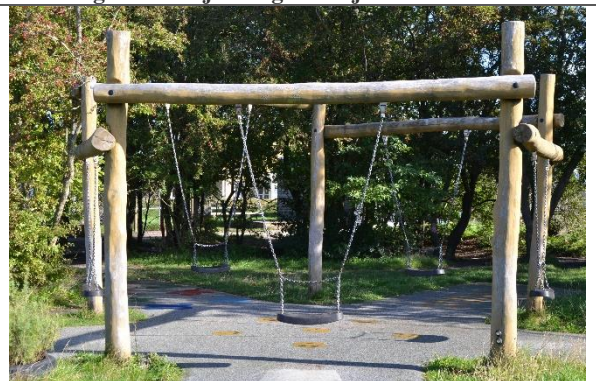
Redskab: Kontaktgynge Årgang: 2017 Producent: Kompan Er redskabet mærket: Ja Er der registreret fejl/mangler: Nej