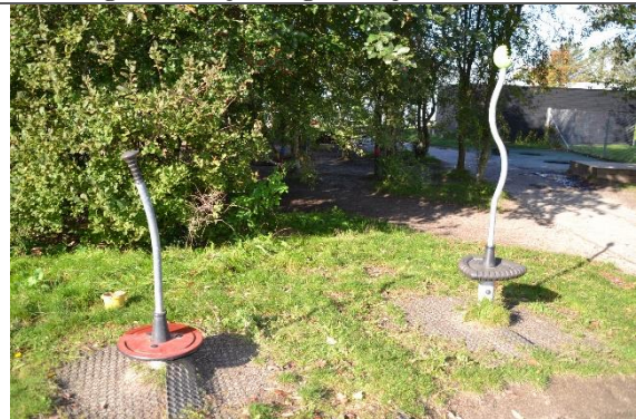
Redskab: Spica Årgang: 2017 Producent: Kompan Er redskabet mærket: Ja Er der registreret fejl/mangler: Ja