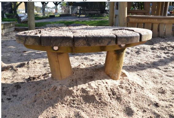
Redskab: Sandbord Årgang: 2017 Producent: Kompan Er redskabet mærket: Ja Er der registreret fejl/mangler: Nej