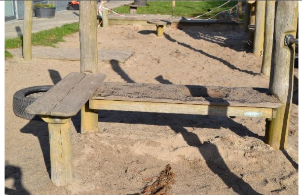
Redskab: Sandbord Årgang: 2017 Producent: Kompan Er redskabet mærket: Ja Er der registreret fejl/mangler: Nej