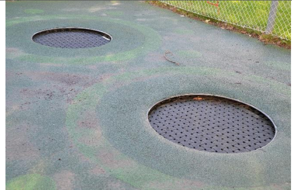
Redskab: Hopperedskab Årgang: 2017 Producent: Eurotramp Er redskabet mærket: Ja Er der registreret fejl/mangler: Ja