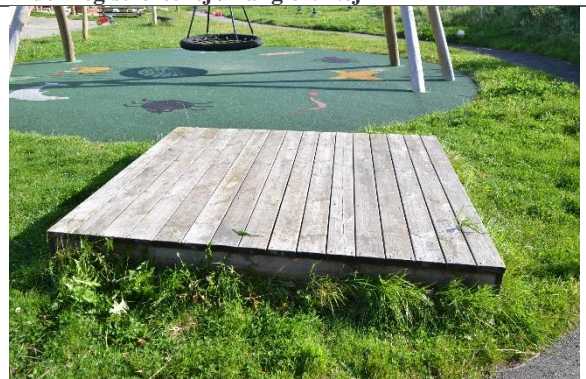
Redskab: Scene Årgang: Producent: Er redskabet mærket: Nej Er der registreret fejl/mangler: Nej