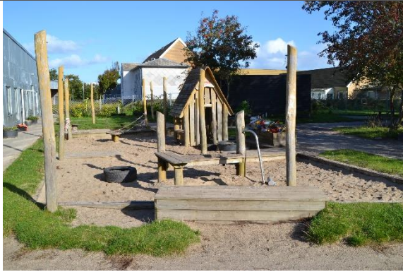
Redskab: Sandkasse med stolper til læsejl Årgang: 2017 Producent: Kompan Er redskabet mærket: Ja Er der registreret fejl/mangler: Nej