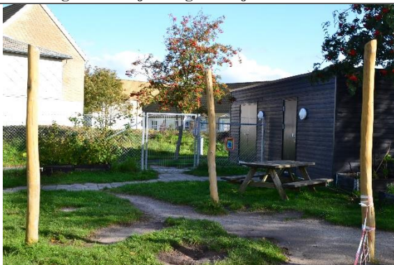
Redskab: Stolper til hængekøjer Årgang: 2017 Producent: Kompan Er redskabet mærket: Ja Er der registreret fejl/mangler: Nej