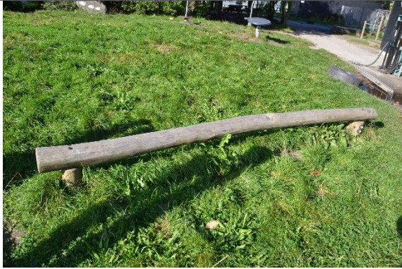
Redskab: Balancebom Årgang: 2017 Producent: Kompan Er redskabet mærket: Ja Er der registreret fejl/mangler: Nej