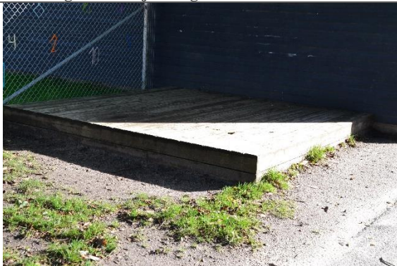
Redskab: Scene Årgang: Producent: Er redskabet mærket: Nej Er der registreret fejl/mangler: Nej